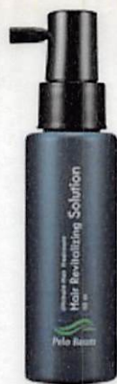
ペロバーム ローション