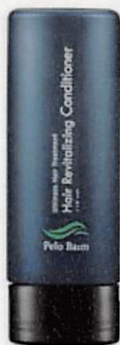
ペロバーム コンディショナー