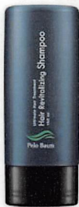
ペロバーム シャンプー